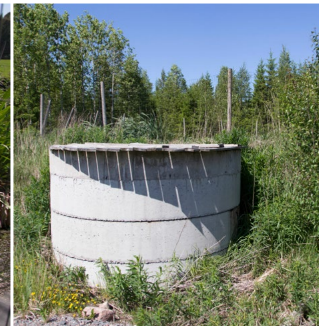
Lietelaguuni on edullinen lietalannan varastoratkaisu. Lietelanta voidaan erillisen kaivon kautta kuormata ilman allaskumin rikkoutumisvaaraa.