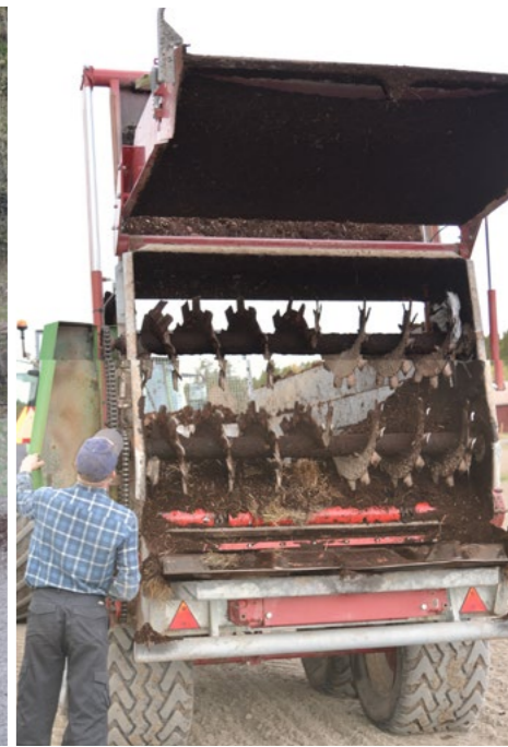
Lietteen siirrossa pumppukuormaimilla varustetut säiliörekka ja levitysvaunu vaativat siirrettävän välivarastokontin ympärille kunnollisen tien. Sijoittava kiekkomultain vähentää ympäristöhaittoja (alhaalla vasemmalla). Levityskalusto tarvitsee siirtoajossa tilaa myös yläpuolella.