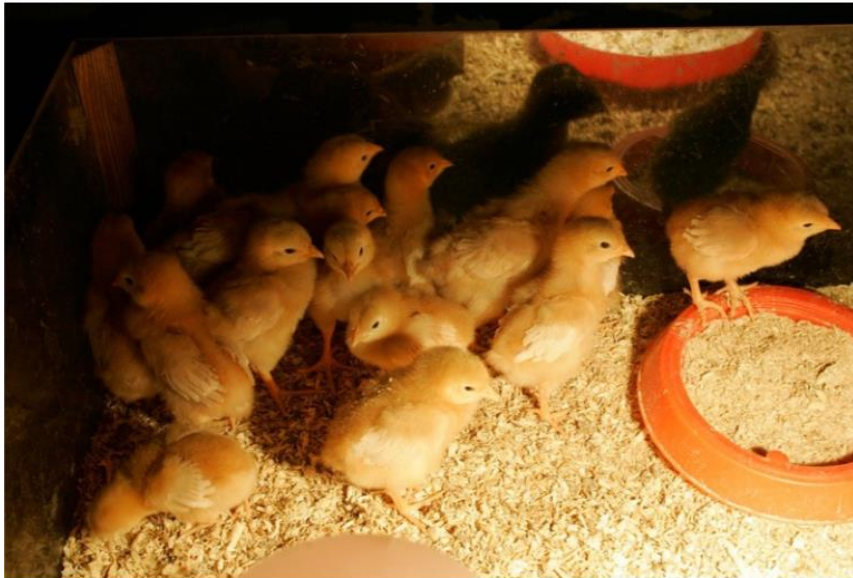
Salmonellatartunnat ovat Suomessa harvinaisia. Kuvituskuva.

Salmonella aiheuttaa yksin Yhdysvalloissa yli 1,2 miljoonan tartuntaa vuosittain. Riskin takia yhdysvaltalaiset kananmunat klooripestaan ja säilytetään jääkaapissa. Suomessa ihmisten salmonellatartunnat ovat pääasiassa peräisin ulkomailta.