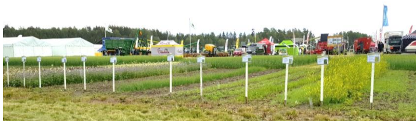
Försök med mellangrödor på Brunnby Lantbrukardagar

Lantbrukardagarna knöt ihop jordbrukets dagsaktuella teman och är på lämpligt avstånd från våra odlingsmarker. Nästa års Brunnby lantbrukardagar ordnas 1-2.juli 2020, vi kan varmt rekommendera ett besök!