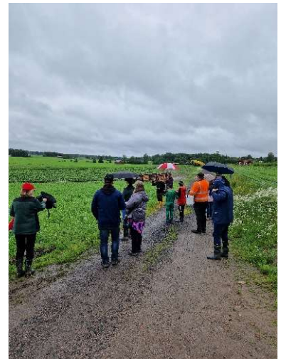
Kuva 13 Kipsi-hankkeen peltopäivässä oli tunnelmaa.