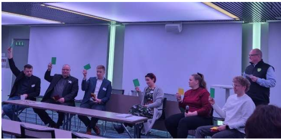
Kuva 8 Liittojen puheenjohtajat ja maaseutunuoret paneelikeskustelussa järjestöriesteilyllä.

Yhdistysten luottamushenkilöille järjestettiin tammikuussa järjestöriesteily yhdessä Satakunnan ja Pirkanmaan kanssa. Yhteensä yli sata MTK-yhdistysten avainhenkilöä kokoontui Turkuun ja Viking Gracelle huoltovarmuusteemaiseen seminaariin ja järjestöriesteilylle. Seminaarissa tarkasteltiin huoltovarmuutta viranomaisten, merenkulun ja maatalouden näkökulmista sekä todettiin suomalaisen ruokaturvan ja alkutuotannon olevan keskeinen osa kansallista turvallisuutta. Ohjelmassa korostuivat kriisinkestävyys, järjestön