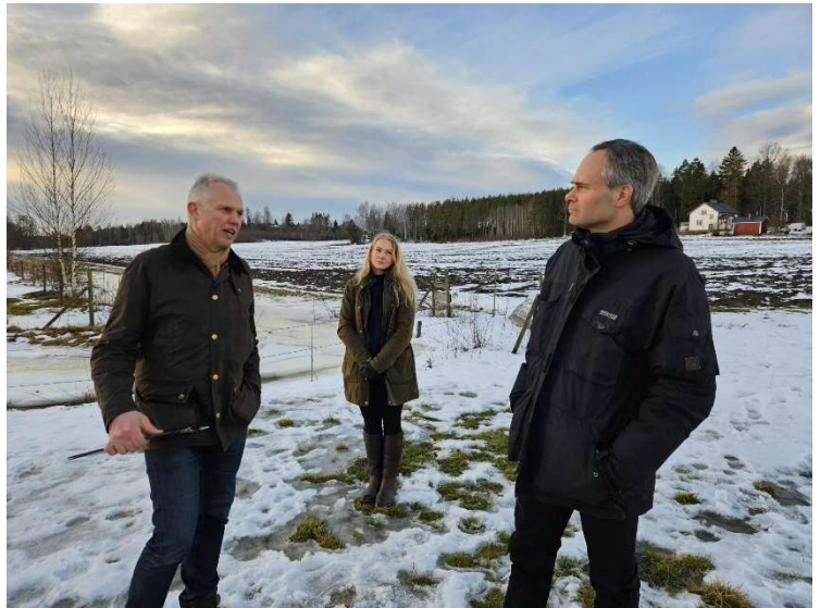
Kuva 1 Liiton edustajat tapasivat tammikuussa ministeri Mykkäsen.