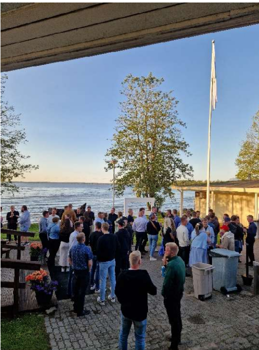
Kuva 12 Valasranta tarjosi upeat puitteet maaseutunuorten illanviettoon

Perinteinen Farm Alive MaNu Okra -illanvietto järjestettiin Okra maatalousnäyttelyn aikaan Valasrannan tanssilavalla Yläneellä. Tapahtuma toteutettiin kolmen lounaisen MTK-liiton ja Keskusliiton yhteistyönä. Tapahtuman suosio on vuosien varrella kasvanut ja tällä kertaa se keräsi paikalle lähes 700 nuorta. Yhteinen ajanvietto, tanssikurssi ja leikkimielinen rastirata viihdytti osallistujia. Yhteistyökumppaneina tapahtumassa oli Sucros ja HK.