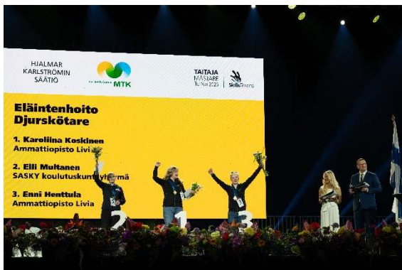
Kuva 5 Taitaja2025 kilpailun eläintenhoiton voittajat

Huhtikuussa liiton edustajat osallistuivat MTK:n valtuuskunnan kevätkokoukseen Espoon Hanasaassa. Noora Syrjä lopetti Maatilat mukaan Saaristomeriohjelmaan -hankkeessa 30.4.2025.