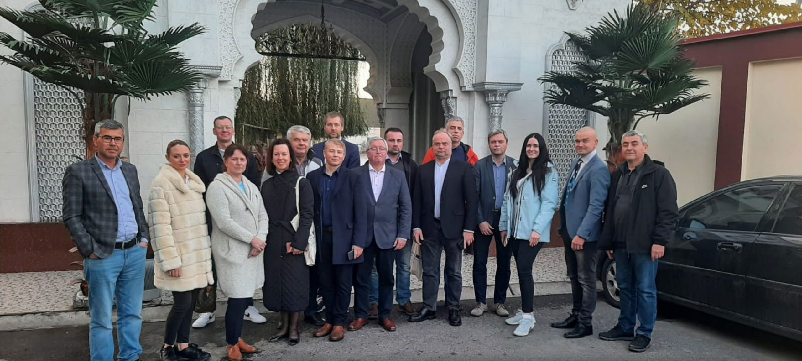
MTK-Satakunta ja MTK-Varsinais-Suomi, BreedExpo2-hanke Uzbekistanin työmatkaraportti 27.11.- 2.12.2023.