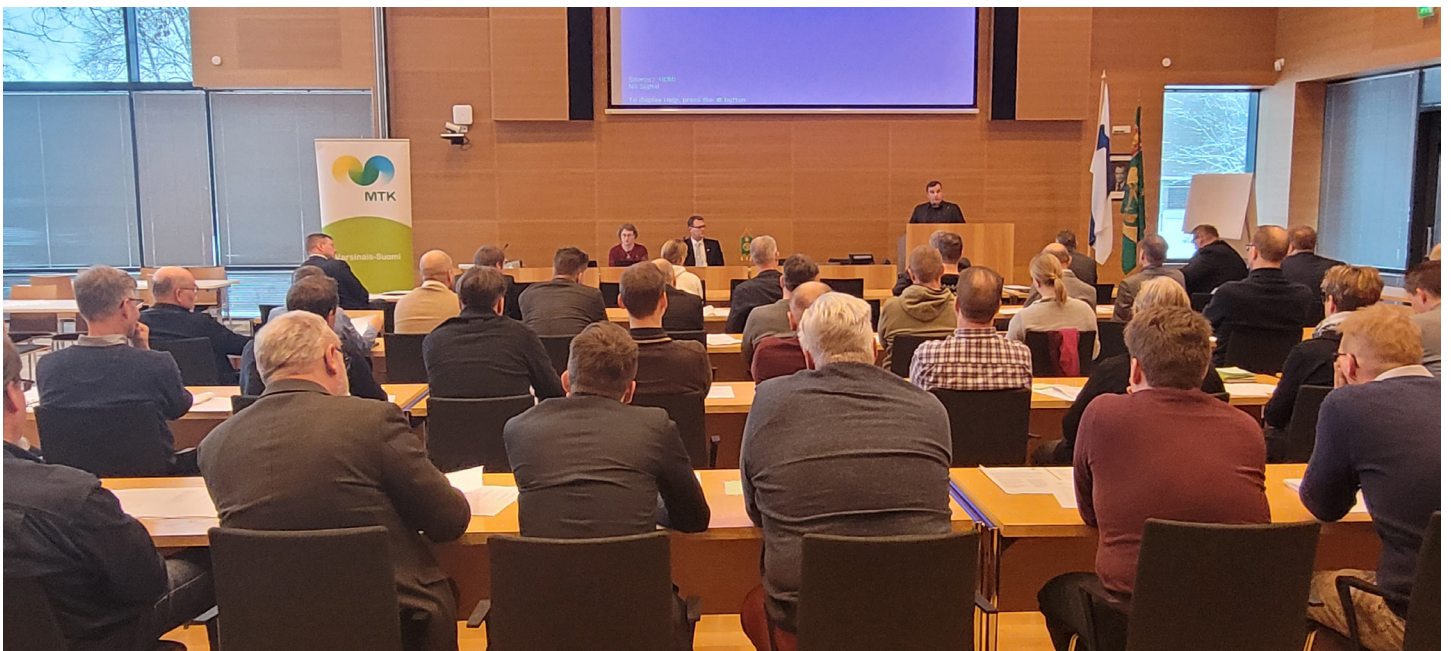
Liiton syyskokous järjestettiin 10.12.2022 Salon kaupungintalolla.

Kokouksen keskustelussa tuli esille, että MTK:n on saatava toiminnallaan nuorempia viljelijöitä toimintaan mukaan ja tuottajayhdistyksen tehtävänä on pyytää nuoria järjestön jäseneksi. MTK:n toivotaan näkyvän paremmin ulos päin. Markkinoilla on menestyttävä, jotta sektorilla voidaan jatkaa tuotantoa. Valtion tukipaketteja ei riitä kaikkiin tilanteisiin.