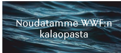
Noudatamme WWF:n kalaopasta

Käyttämämme soija on 100-prosenttisesti sertifioitua.