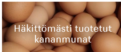
Häkittömästi tuotetut kananmunat

Tavoitteenamme on, että vuoteen 2024 mennessä kaikki käyttämämme palmuöljy on segregoitua.