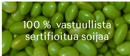
100 % vastuullista sertifioitua soijaa

Olemme sitoutuneet käyttämään vain häkittömien kanaloiden munia vuoteen 2024 mennessä.