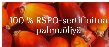
100 % RSPO-sertifioitua palmuöljyä

Tavoite: Vuoteen 2025 mennessä Suomen ja Ruotsin kuluttaja-tuotteissa käytetty vilja on 100-prosenttisesti kestävän viljan-viljelyn periaatteiden mukaista.