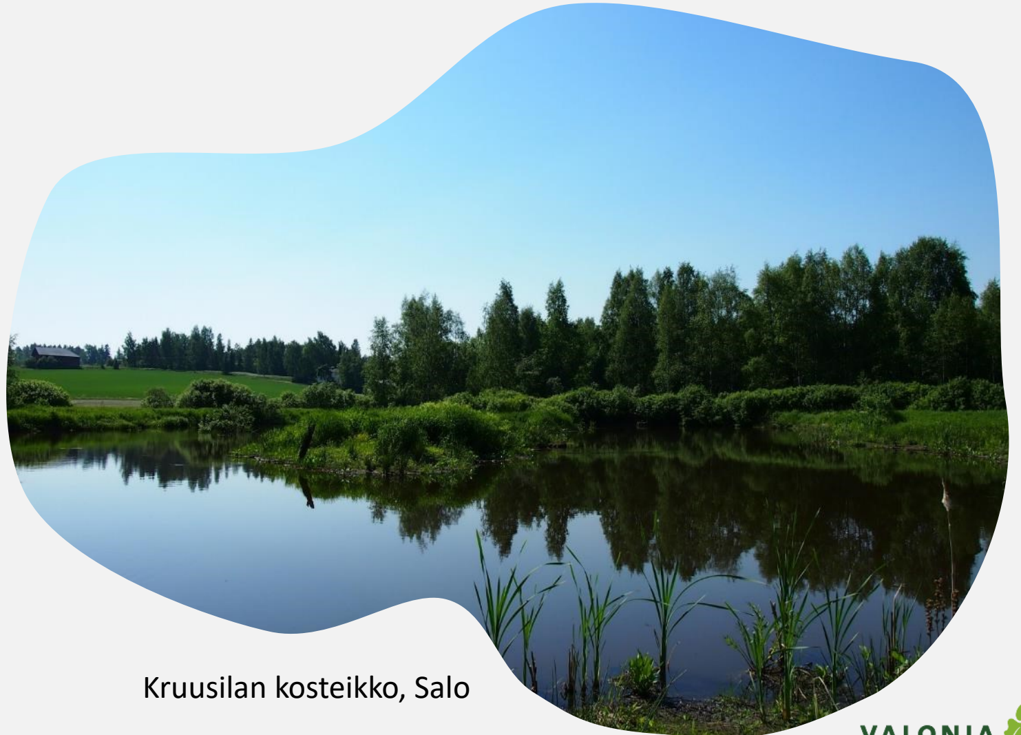
Kruusilan kosteikko, Salo